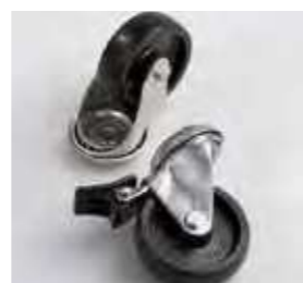
Equipado com rodas.