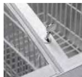
As tampas de correr incluem fechadura com chave.