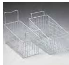
Cesta para uma melhor exposição do produto (opcional).