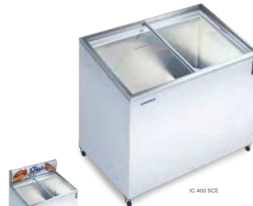
IC 400 SCE