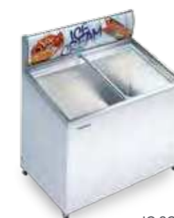
IC SCE com display