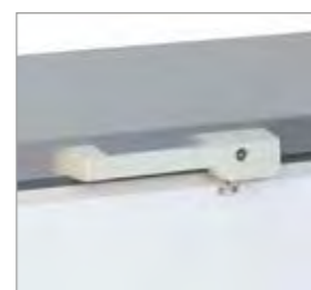
Manipulo com fecho e chave.