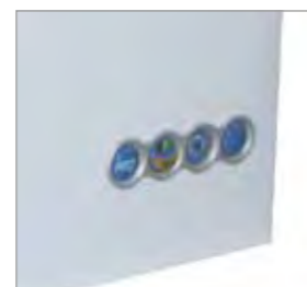
Quadro de comando.